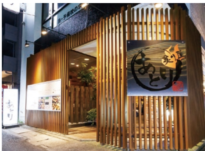
▲「炙り屋あとり」外観。入口を開けると香ばしい炭火焼の香りがお出迎え。

小規模事業者ならではの視点で創出した新規事業で経営革新計画の承認を取得し、現在、事業化に向けた様々な取組みを展開されています。