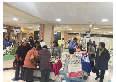
ふるさと企業いいもの発掘市