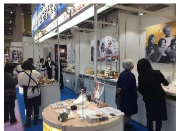
東京インターナショナルギフト・ショー