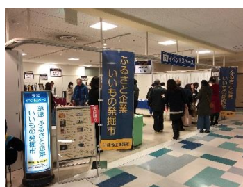
ふるさと企業いいもの発掘市