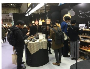
東京ギフトショー