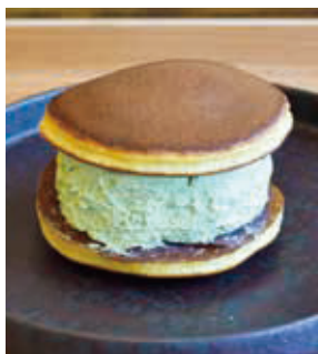
生クリームたっぷりの抹茶生ドラ