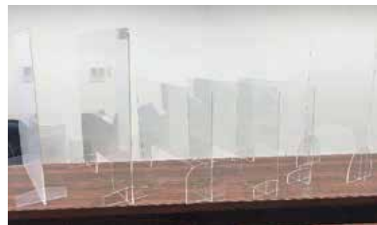
飛沫感染防止パネル