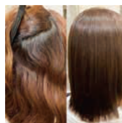
リアン式ストレート施術 ビフォーアフター