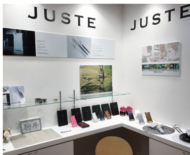
▲ ファッションワールド出展の際の同社のブース

今後も金属精密加工技術の魅力を一人数でも多くの方に伝えるべく、展示会や様々なプロモーション活動に取り組んでおられます。